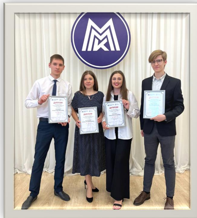
2022 – 2023 Победители научно-технической конференции молодых специалистов ПАО «ММК»