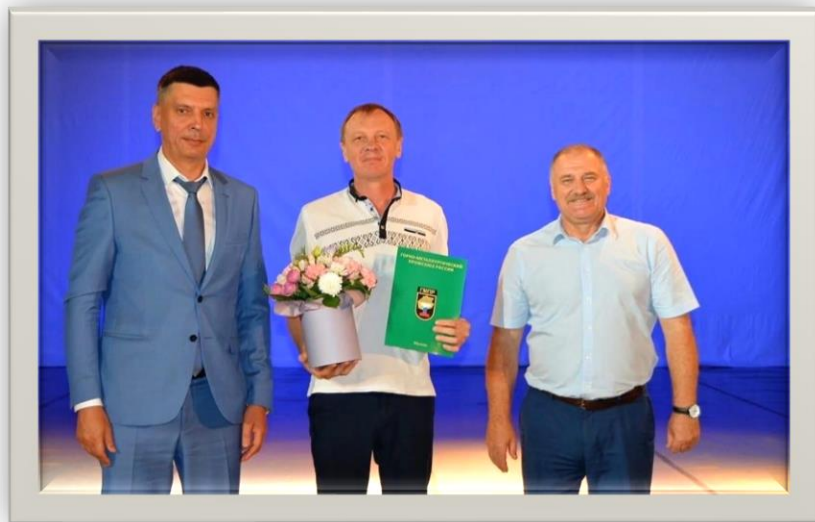
2023 год награждение за активную работу ППО Группы ПАО «ММК» ГМПР